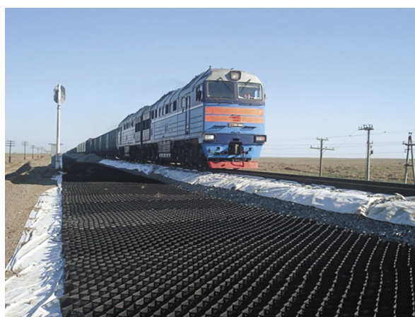
Рис. 4. Геоячейки «ПРУДОН-494» в конструкции основания железнодорожных путей

и сооружений. Такие конструкции увеличивают несущую способность и дренирование грунтов под дорожным полотном, обеспечивают устойчивость и снижение деформаций основания и передачу нагрузок на более прочные слои. На рис. 3 показан вид расчетной схемы исследуемого объекта на грунтовом основании, усиленном вертикальными столбами из щебня, смоделированном в программном комплексе Midas GTS NX [1].