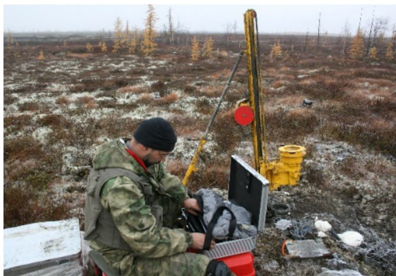
Рис. 1. Установка скважины геотемпературного мониторинга состояния грунтов основания в ходе экспедиции «Трансполярная магистраль»

Одной из особенностей слабых грунтов, в т.ч. связных грунтов, яв-